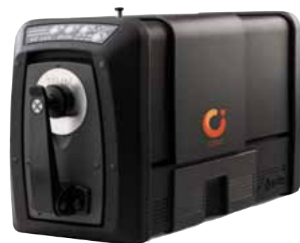
Gli spettrofotometri a sfera Ci7800 e Ci7600 di ultima generazione offrono più valore a tutte le supply chain del colore

I nuovi spettrofotometri di X-Rite, ovverosia il modello di alta gamma Ci7800 e la versione più economica Ci7600, rappresentano un eccezionale balzo in avanti nella produzione e gestione dei preziosi dati provenienti dalle misurazioni cromatiche eseguite lungo l'intera supply chain del colore. A differenza di tutti gli spettrofotometri industriali che li hanno preceduti, gli spettrofotometri a sfera Ci7800 e Ci7600, uniti al software Color iControl di X-Rite, possono integrarsi in qualsiasi supply chain del colore (comprese quelle che impiegano strumenti di altri produttori). Inoltre, se abbinati a Color iQC o Color iMatch, gli spettrofotometri serie Ci7800 e Ci7600 garantiscono automaticamente una corretta impostazione degli strumenti, tengono traccia delle conformità ai requisiti di misurazione e registrano le immagini relative a ogni campione misurato. Il risultato è un processo di misurazione e gestione